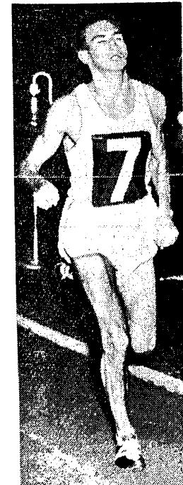
Herbert Elliott (Australia) — sportowcem świata nr 1 1958, według ankiety ISK.