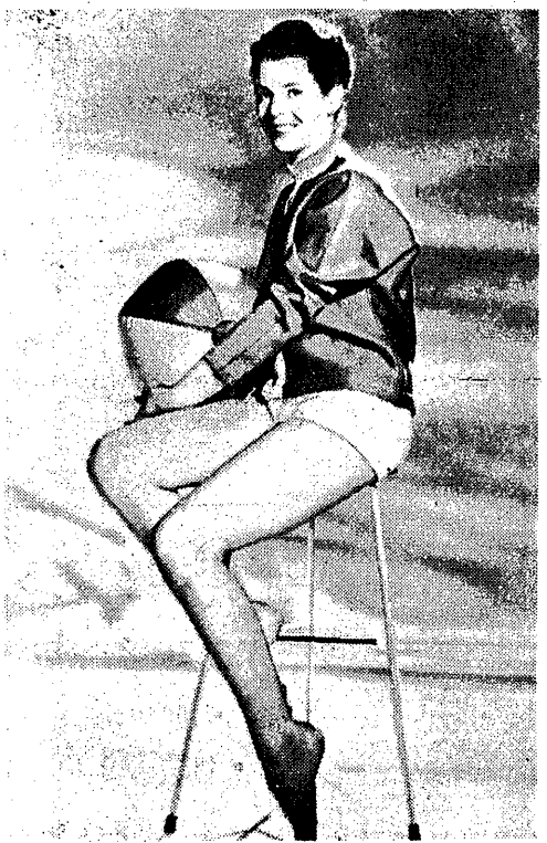
Mistrzyni olimpijska z Melbourne 19-letnia pływaczka angielska Judy Grinham próbuje swoich sił w filmie, wkrótce wstąpi w roli nauczycielki.