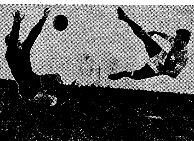
Z ligowych rozgrywek piłkarskich w Grecji. Fragment efektownej parady bramkarza drużyny Panathinaikos i baletowego wyskoku, połączonego ze strzałem, napastnika drużyny Olympiakos. Wynik meczu remisowy 1:1.