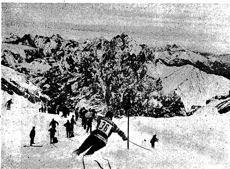
Członkowie narciarskiej ekipy Austrii, NRF, USA i Szwajcarii trenują w Alpach Bawarskich na Zugspitze.