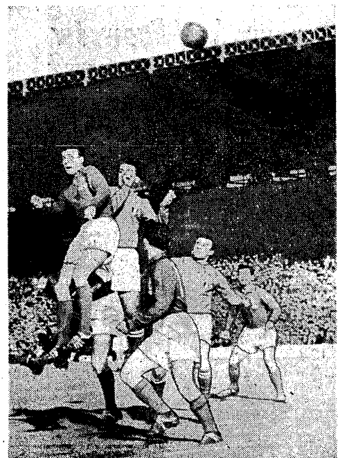
Fragment z meczu Francja — Włochy, zakończonego remisem 2:2. Moment pod bramką Włochów. Pierwszy z prawej „król strzelców” z ostatnich mistrzostw świata — Fontaine.

STOKHOLM. Pomyślnie wypadł drugi występ hokeistów kanadyjskich Kelowna Packers w Europie. Po porażce z reprezentacją Szwecji w drugim meczu Kanadyjczycy zwyciężyli drużynę Szwedzów 5:2 (2:1, 1:0, 1:0). O losach tego spotkania zdecydowała pierwsza trzecia. Szwedzi rozpoczęli grę od ataku i 10. min. rozegrali się szturmem hokeistów kanadyjskich. W ciągu czterech minut zdobyli oni 4 bramki. W następnych trzech grę była wyrównana. (PAP)