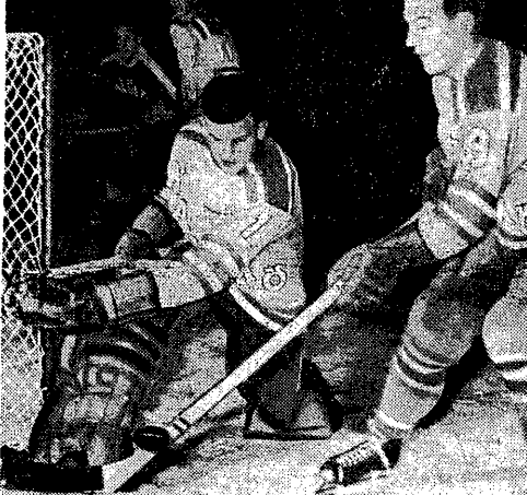
Bramkarz FF Malmö często bywa w ciężkiej opresji podczas tournée tej drużyny po Polsce. Z pomocą przychodzi mu obrońca, a nawet napastnicy.