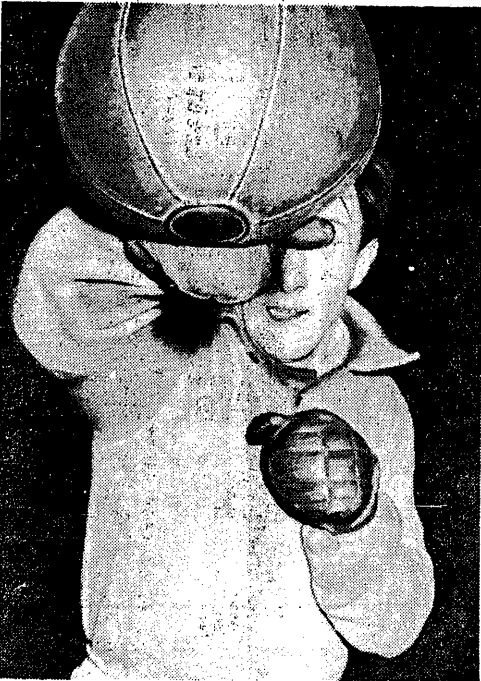
pod „W NIEDZIELĘ”

Przebieg pierwszej trzeci i ostatnie 10 min. ostatniej najbar-