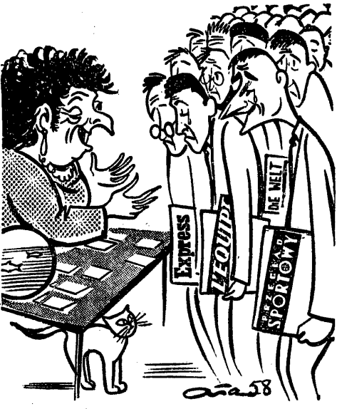
Wredka do dziennikarzy, speców od lekkiej atletyki... Rys. E. Alaszewski