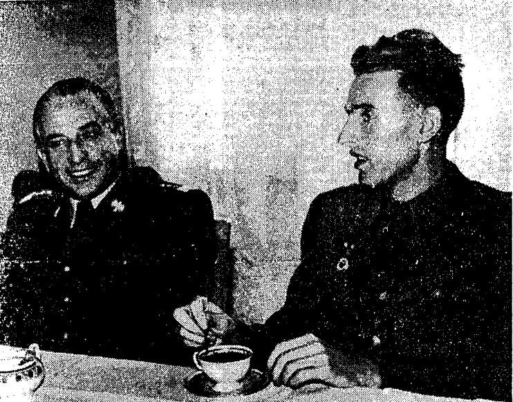
Z okazji święta Ludowego Wojska Polskiego przedstawiamy naszym Czytelnikom powyższe zdjęcie, ilustrujące doskonale „sojusz” wojska ze sportem. Minister Obrony Narodowej gen. broni Marian Spychalski przy czarnej kawie rozmawia z kpt. Zdzisławem Krzyszkowiakiem, jednym z najwybitniejszych sportowców Polski, podwójnym mistrzem Europy. (O sporcie w Wojsku Polskim czytamy na str. 2)