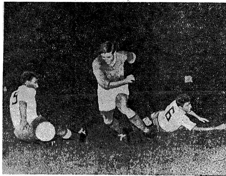
Kopaczewski „wykolewał” dwóch obrońców greckich w czasie meczu Francja — Grecja 7:1