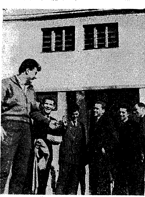
Janusz Sidło cieszy się zawsze wielką popularnością. Oto oglądamy go w dniu otwarcia nowego roku szkolnego na terenie AWF, gdzie znalazł w gronie młodych studentów wdzięcznych słuchaczy

Studia na AWF rozpoczynają w nowym roku akademickim ponad 600 chłopców i dziewcząt, w tym około 100 nowych studentów. Młodzież, która pragnie zdobywać wyższe kwalifikacje w tak pięknej dziedzinie życia, jaką jest sport, pozostanie w nowym roku studentami dotychczasowych wyników w nauce i zadowolenia z obranego kierunku. W tym celu za pracowników naukowych uczelni — fałszywych sukcesów i osiągnięć w pracy.