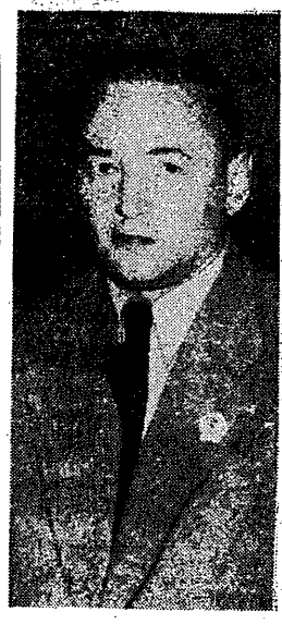
Włodzimierz Reczek, przewodniczący Głównego Komitetu Kultury Fizycznej

W Rzymie już wre olimpijska gorączka o czym na str. 2 przeczytajcie w wywiadzie z Wł. Reczkiem