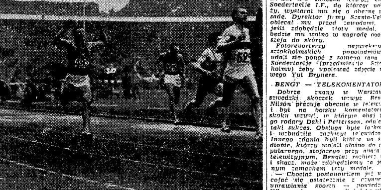
Pasjonujący finał 200 m mężczyzn. Od lewej: 419 Segal (Anglia) — 2 miejsce, 365 Brightwell (Anglia) — 5, 493 Mandlik (CSR) — 4, 325 Kononauow (ZSR) — 6, 77 Delecour (Francja) — 3, 522 German (Niemcy) — 1. Fot. CAF

ZYGMUNT GLUSZEK W tymczasem przy drugim biegu stolu trener OGOLIN z ożywieniem rozprawił się z trenerem Szwedów o naszym trójściskowym zwycięstwie. Do czasu naszych dotychczasowych zwycięstw, zwycięstwo polskim trójściskowym zwycięstwem.