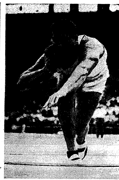
Parry O'Brien, dla którego granica 19 metrów przeszła już dawno istnieć, będzie w Warszawie rzucał także dyskiem, w zastępstwie Al Oetera, którego sprawy rodzinne wycwały na-...