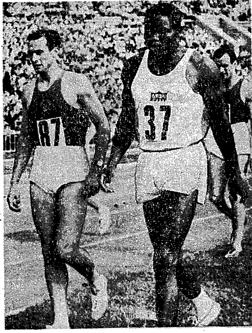
Oto dwaj bohaterowie, z walki których narodził się wielki rekord świata: Rafer Johnson i Wasył Kuzniecow.