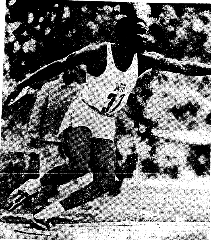
Refer Johnson, największy z wielkich, rekordzista świata w dziesięcioboju, zadziwił widzów na moskiewskich Łużnikach. Za dwa dni zobaczymy go na Stadionie Dziesięciolecia.

31 LIPCA 1958 Nr 121 (3145) WARSZAWA CENA 80 groszy