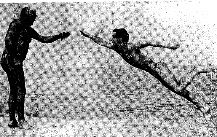
Sprawozdanie z mistrzostw na str. 3.

OSLO, 18.7. W Oslo na stadionie Bislet rozpoczął się wielki międzynarodowy mityng lekkoatletyczny z udziałem reprezentantów Stanów Zjednoczonych i Francji. W pierwszej konkurencji dnia — 400 m p.p. wspaniała forma zdemontował Glenn Davis. dystans 400 m p.p. Amerykanin przebiegł w 49,8, a więc uzyskał wynik tylko o 0,5 gorszy od najlepszego na świecie mistrza. W biegu na 800 m triumfowali Norwegowie. Zwyciężył Boyesen, który uzyskał 1:45,8 przed swoim rodakiem Lundhem 1:47,8. Dopiero na trzecim miejscu uplasował się Amerykanin Sowell z wynikiem 1:48,3. Z pozostałych konkurencji na szczycie stawki zwyciężył rykowski oserczepem meczystym, w którym spotkali się — mistrz olimpijski i rekordzista świata — Francuz i Francuzem Maquet. Zwyciężył Francuz z wynikiem 77,76. Rekordzista świata uplasował się na drugim miejscu uzyskując 75,76 m w rzucie dyskiem triumfował Babka (USA) — 84,65. Glenn Davis w 56 minut po zwycięskim biegu na 400 m p.p. startował w biegu na 200 m uzyskując 21,1. Wygrał on w tym biegu z Francuzem Bertozzi 21,8. W biegu na 110 m p.p. Norweg Olsen zwyciężył niespodzianie. Irlandczyk Kinselle, Olsens uzyskał 14,8, a Kinsella 14,7 sek.