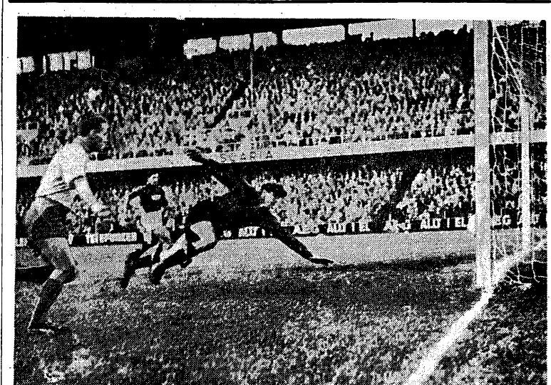
W rozgrywkach o mistrzostwo świata piłkarska drużyna Szwecji pokonała zespół ZSRR 2:0 Na zdjęciu: Kurt Hamrin zdobywa bramkę dla Szwecji