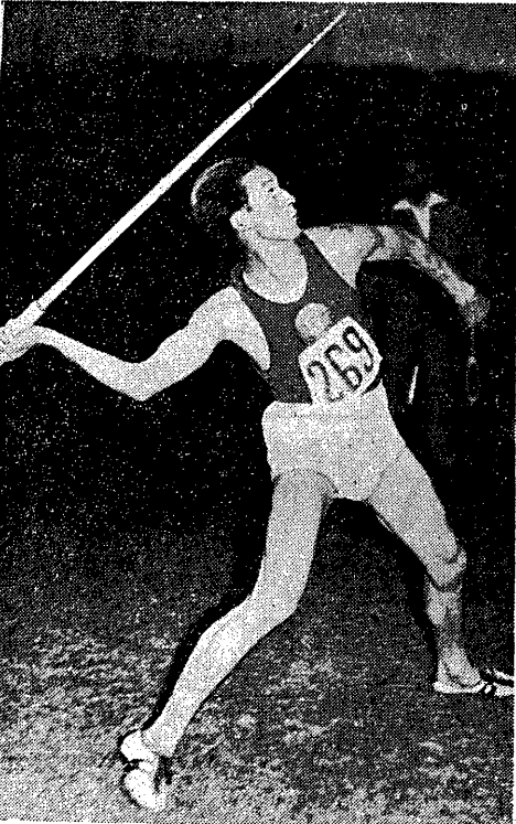
8.000 tys. pkt. w dziesięcioboju dla Europejczyka, to granica wyspiarskiej. Pierwszym, który ją przekroczył (8.014) okazał się lekkoatleta radziecki Wasili Kuzniecowa, mający apetyt na wynik jeszcze lepszy.