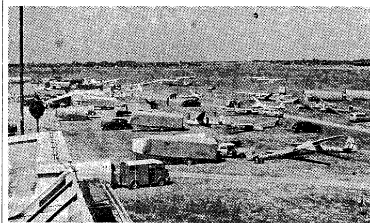
Z szymbowców mistrzostw świata w Lesznie - ostatnie przygotowania maszyn przed kolejnym startem