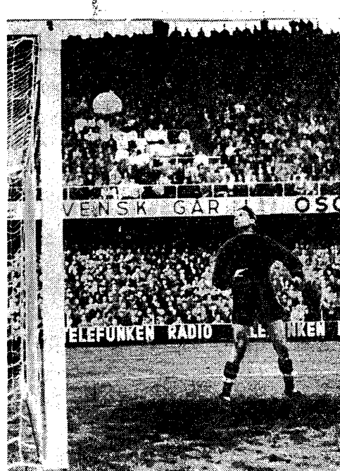
Świetny przed laty bramkarz węgierski Grosics nie pomógł. Mecz Szwecja — Węgry wygrali gospodarze 2:1. Na zdjęciu: Grosics puszcza gola zdobytego przez Hamrına.

Jedynym faworytem w tych czterech spotkaniach jest Brazylia. Bardzo silny i wypoczęty zespół, który powinien zwyciężyć pewnie i w wysokim stosunku bramkowym. Z równymi szansami przystępują do meczu Niemcy i Jugosławia. Obie drużyny reprezentują dobry poziom.