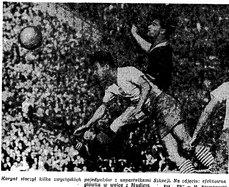
Korynt stoczył kilka zwycięskich pojedynków z napastnikami Szkocji. Na zdjęciu: efektywna główka w walce z Mudiem.