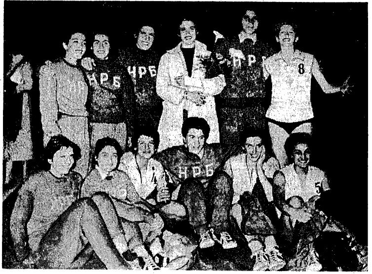
Uśmiechnięte, szczęśliwe i radosne po wygraniu meczu z ZSRR — koszykarki Bułgarii, mistrzynie Europy 1958 r.