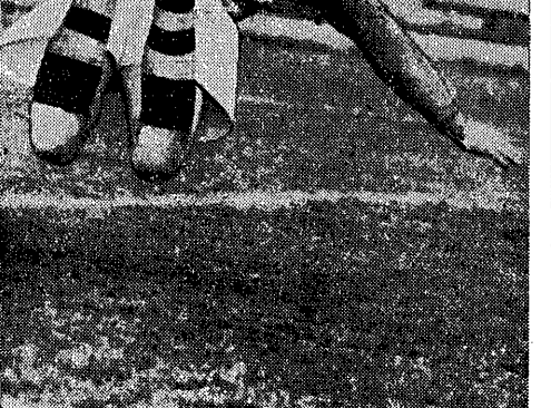
Takiego ujęcia bramkarza chyba jeszcze nie widzieliśmy. Nasz fotoreporter...