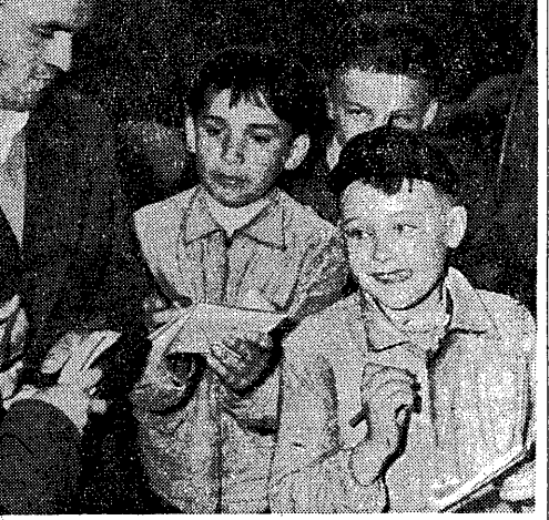
— Aż slinka leci! Taaki podpis dostanie za chwilę mały łowca autografów...