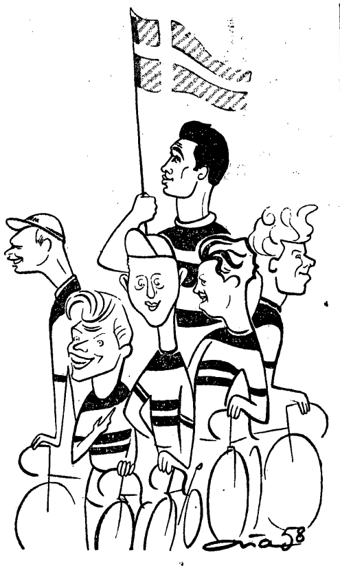
Obrońcy honoru Danii (mający piękne tradycje w wycięgu pokoju)...

PRZEGLĄD SPORTOWY WYDZIAŁOWY PRASA SPORTOWA