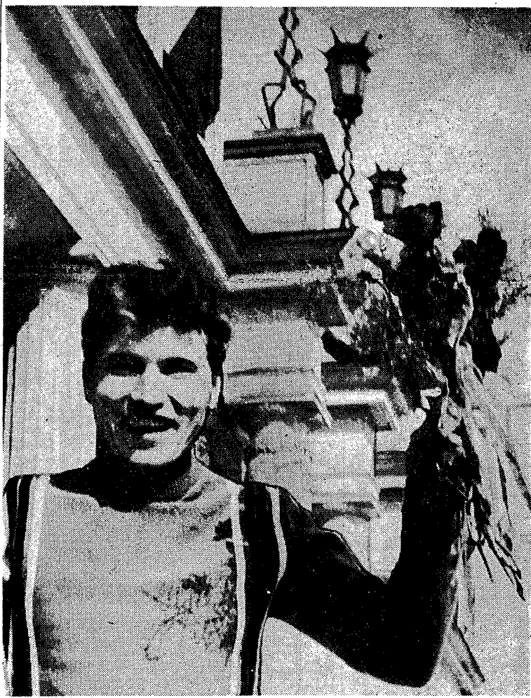
Goście o północy...

120 KOLARZY reprezentujących 20 państw wystartuje w piątek 2 maja do I etapu XI Wyciągu Pokoju „Trybuny Ludu”. „Neues Deutschland” i „Rudeho Pravda” na trasie Dookoła Warszawy, długości 110 km. Start honorowy nastąpi na Stadionie Dziesięciolecia o godzinie 14.15. Uroczystość tę poprzedzą: o godzinie 14.00 hejnał Wyciągu Pokoju i wejście kolarzy na bieżnię, o godzinie 14.06 przemówienie Przewodniczącego Komitetu Organizacyjnego XI Wyciągu Pokoju, redaktora naczelnego „Trybuny Ludu”, Leona Kasmana, o godzinie 14.10 przemówienie Prezesa Międzynarodowej Federacji Kolarskiej (UCI) p. Adriano Rodoni (Włochy); przemówienie to będzie przetłumaczone na język polski, o godzinie 14.13 p. A. Rodoni da sygnał do startu honorowego, o godzinie 14.15 — wzlot gołębi i runda honorowa kolarzy. Start ostry nastąpi o godzinie 14.30 na ul. Stalingradzkiej, po czym kolarze przejadą przez Henryków (g. 14.42), Jabłonno (g. 14.50), Nowy Dwór (g. 15.15), a następnie w kierunku Warszawy przez Kazuń (g. 15.23), Łomianki (g. 15.45) do Białan (pry AWF będą o g. 16.00). Przejazd przez miasto odbędzie się następującymi ulicami: Plac Komuny Paryskiej, Mickiewicza, Nowotki, Plac Dzier-