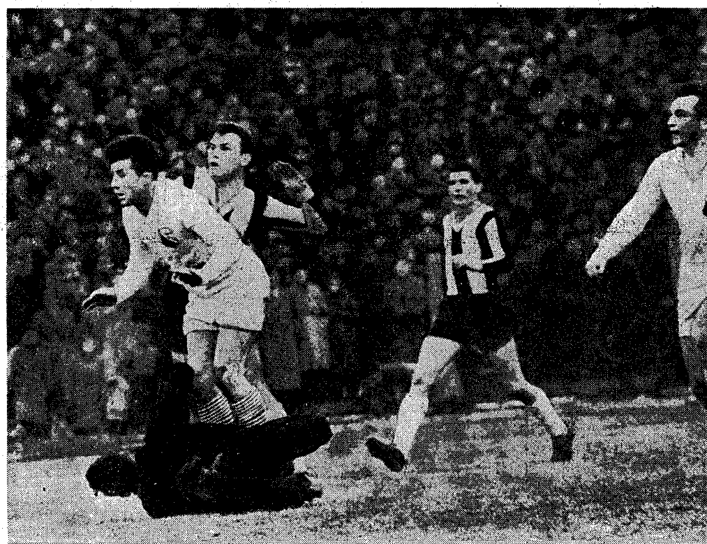
Obrońca Legii w opalach. Stroniarz asekurowany przez Masę...