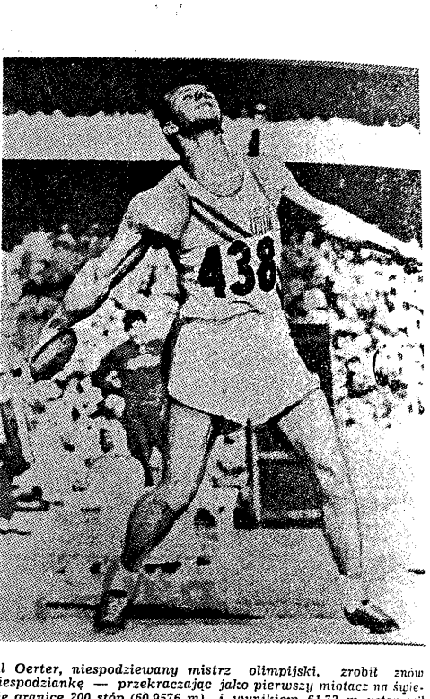
Al Oerter, niespodziewany mistrz olimpijski, zrobił znowu niespodziankę — przekraczając jako pierwszy miotacz na świecie granicę 200 stóp (60,957 m) i wynikiem 61,72 m ustanowił nowy rekord świata w rzucie dyskiem.

Nie przeszkadza to jednak Gordonowi planować ponowne odwiedzenie Freiburga w lipcu, jako że zamierza „pod skrzydłem” Gerschlera nabrać ostatecznego szlif przed mistrzostwami lekkoatletycznymi Europy.