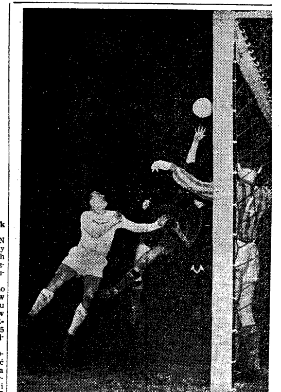
Z półfinałowego meczu o Puchar Europy Real Madryt — Vass Budapest 4:0. Pod bramką z lewej — Di Stefano

Do ZSRR wyjadą: Gwardia Warszawa, LKS Łódź, Polonia Bytom, Lech Poznań i Stal Mielec. W Polsce zaś gościć będą następujące drużyny radzieckie: Molodowa (dawniej Burewiestnik), Kiszyniów, Skrzydła So-