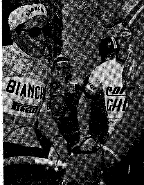
Coppi i Anquetil przed startem do wyścigu kolarskiego Pariz - Nicea