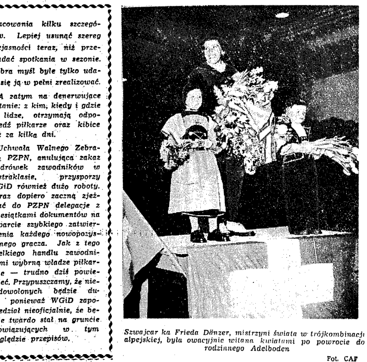
Szwajcar ka Frieda Dänzer, mistrzyni świata w trójkombinacji alpejskiej, była owacyjnie witana kłopotami po powrocie do rodzinnego Adelboden