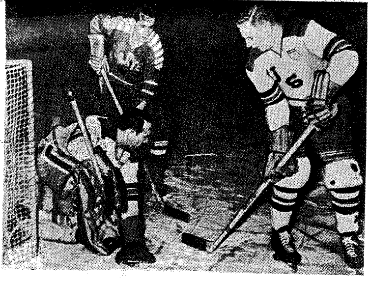
Z występu amerykańskich hokeistów w Anglii — fragment spotkania USA — Paiskey Pirates 4:2

Ponieważ sprawa jest nadal dyskusyjna, wyrażamy się szczerze, aby PZHL rozpatrzył ponownie to zagadnienie i chyba najlepiej, aby uczynił to przy udziale przedstawicieli GKKF i prasy.