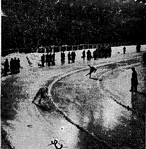
Z mistrzostw świata w jeździe szybkiej na lodzie rozegranych w Helsinkach — fragment biegu na 500 m, który prowadzi zwycięzca biegu Merkulow (ZSRR)