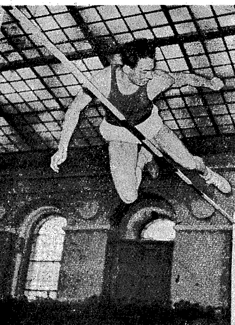
Barzo obiecująco rozpoczął sezon najlepszy skoczek radziecki Jurij Stiepanow, który podczas zawodów w hali w Leningradzie uzyskał najlepszy wynik na świecie 209

Sensacje pod koszem LKS wygrywa z Legią str. 3