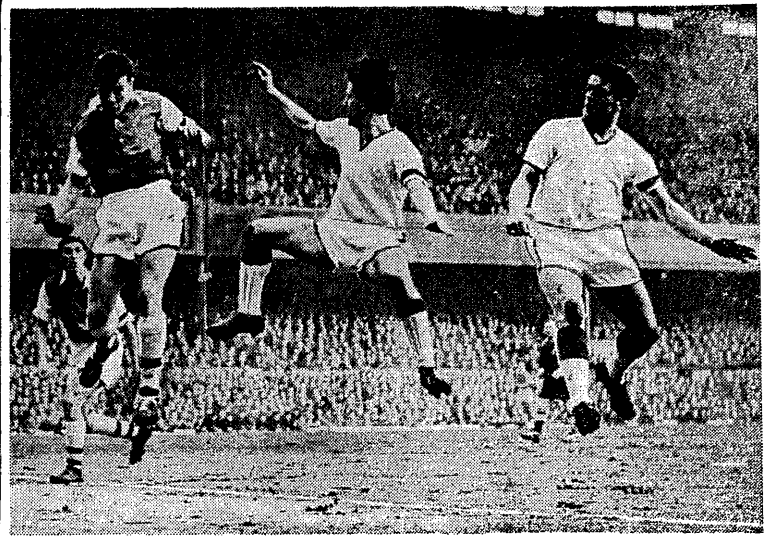
Jeden z ostatnich swych meczów piłkarze Manchester United rozegrali w ub. sobotę z Arsenalem, pokonując swych przeciwników 5:4.

Grochołska nie pamięta, jak przejechała górny odcinek trasy. Nie pamięta ona zbyt szybko i już na półmetku jej czas nie