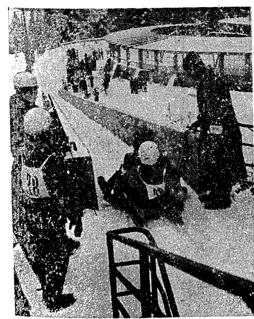
Start dwójek na mistrzostwach Polski w Krynicy