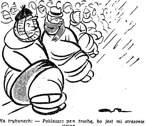
Na trybunach: — Poklaskuj pan trochę, bo jest mi strasznie zimno