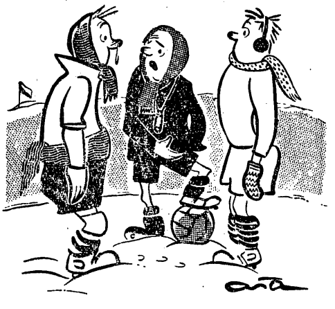
Sędzia przed meczem: — Nie mają panowie rozmiąć 100 zł — już trzecia złotówka ginie w śniegu.