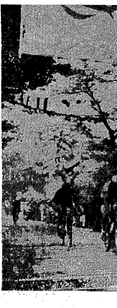
W Egipcie odbywa się doroczny wyścig kolarski dookoła Egiptu. Nasze zdjęcie przedstawia finisz kolarzy na I etapie wyścigu