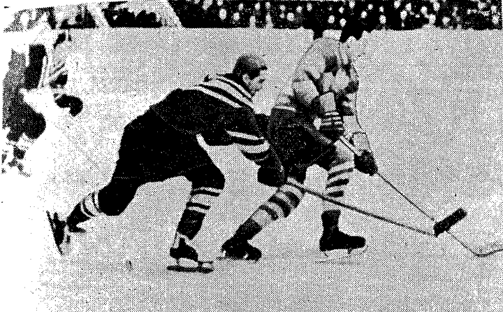
Kurek w akcji podczas meczu międzynarodowego w hokeju na lodzie między reprezentacją Polski i ZSRR.

21 STYCZANIA 1958 Nr 12 (3036) WARSZAWA Rok założenia 1921 CENIA 80 groszy