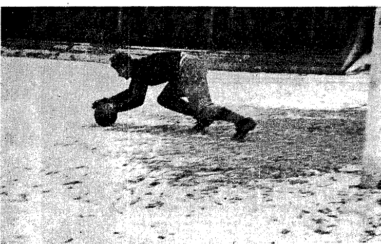
Pikarze, mimo śniegu i zimna, znowu wyjeżdżają na boiska. Przed mrozem uchroni bramkarza ciepły dres, rękawiczki i sweter.

KTOŻ z nas nie chciałby założyć własnego zespołu w sportach motorowych? Niestety, nie jest to łatwe zadanie. Tymczasem dla 1000 członków Polskiego Związku Motorowego stanowią one ostatnie nadzieje. Długoletni kierownik Biura Turystyki Motorowej nie jest organizatorem zawodów, ale przede wszystkim opiekunem, który pomaga w organizacji. Jedną z jego zadań jest wyjazd do zagranicy, aby poznać bliżej amatorski świat. Istotną rolę w tym odgrywa wyjazd do Ameryki, gdzie w ramach zjazdu w składzie 10-12 osób, w tym 20 pkt. z trójką jego najbliższych współpracowników, w tym 20 pkt. z trójką jego najbliższych współpracowników, w tym 20 pkt. z trójką jego najbliższych współpracowników.