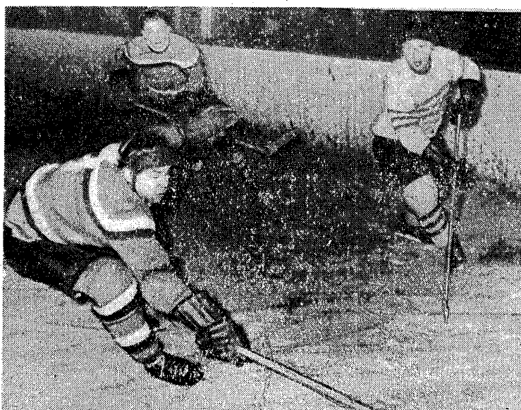
Chodakowski w akcji podczas spotkania kadry polskiej ze Spartakiem.

Co prawda „syntetyczny” występ naszych reprezentantów można częściowo usprawiedliwić pośpiechem, z jakim montowano skład, i brakiem kilku czołowych zawodników. Wzrostło to jednak nie może przekreślić braków, jakie wykazał hokeiści polscy w spotkaniu ze Spartakiem.