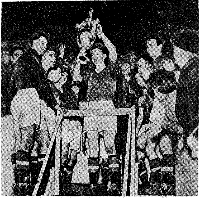
Roger Byrne w otoczeniu graczy drużyny Manchester United z nagrodą za zdobycie tytułu mistrza ligi angielskiej w roku 1957.