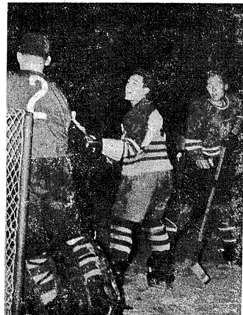
Fragment spotkania w hokeju na lodzie pomiędzy Legią Warszawą i Bankiem Chomutów, które zakończyło się zwycięstwem gości 3:4.

ZAKOPANE, 1. I. (tel. wt.). Również i Nowy Rok zastał Zakopane bez śniegu, a tego nie pamiętają najstarsi mieszkańcy Zakopanego. W czasie świąt, zapchane gości do ostatecznego miejsca, zaczęło gwałtownie padać śnieg. W Nowy Rok, ludzie skrzętnie wtrącają, gdyż nie mogą doczekać się normalnej zimy. Niektórzy przestali już wierzyć, że może w ogóle paść śnieg w ciągu tej zimy i żartują, że ma być w grudniu i styczniu wyjątkowo łagodne... lato. Ale żarty na bok, brak śniegu w Tatrach jest dla narciarzy, przygotowujących się do sezonu, prawdziwą klęską.