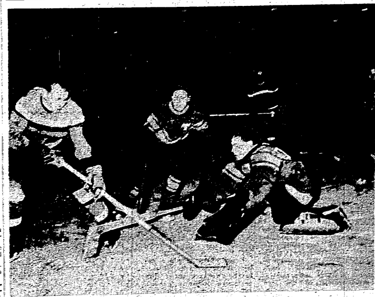
W meczu Warszawa — Torpedo Gorki 2:3, z którego powyższy fragment reprodukujeśmy, nasi hokeiści nie popisali się dobrze. Wykazał dość braków w grze zespołowej i nie wykorzystali licznych sytuacji podbramkowych. Na zdjęciu bramkarz Torpeda likwiduje wypad jednego z napastników polskich.

W dniach 12 i 13 bm. drużyna dostąpiła wyjazdu do Rostocka, 14 bm. z drużyną z Rostocka, 15 bm. z drużyną z Rostocka, 16 bm. z drużyną z Rostocka, 17 bm. z drużyną z Rostocka, 18 bm. z drużyną z Rostocka, 19 bm. z drużyną z Rostocka, 20 bm. z drużyną z Rostocka, 21 bm. z drużyną z Rostocka, 22 bm. z drużyną z Rostocka, 23 bm. z drużyną z Rostocka, 24 bm. z drużyną z Rostocka, 25 bm. z drużyną z Rostocka, 26 bm. z drużyną z Rostocka, 27 bm. z drużyną z Rostocka, 28 bm. z drużyną z Rostocka, 29 bm. z drużyną z Rostocka, 30 bm. z drużyną z Rostocka.