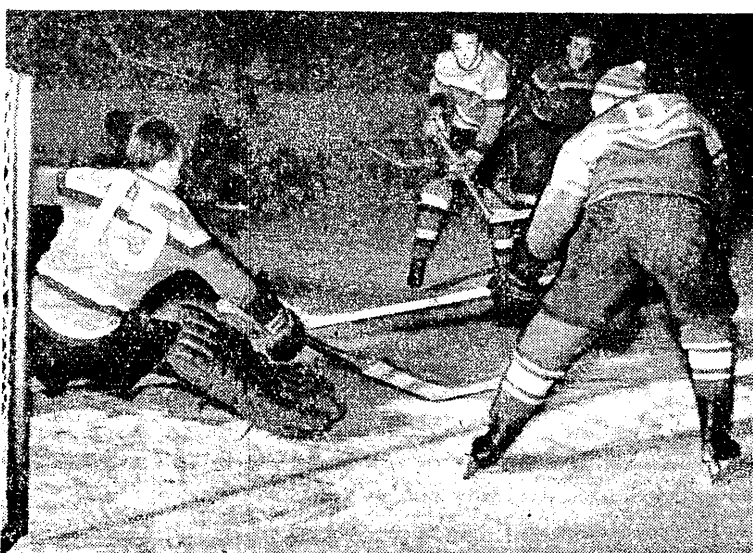
Moment międzynarodowego meczu Torpedo Gorki — Warszawa to hokeju na lodzie, który zakończył się zwycięstwem zawodników radzieckich 3:2. Na zdjęciu: Pabisz broni jeden z groźnych strzałów zawodnika Torpedo