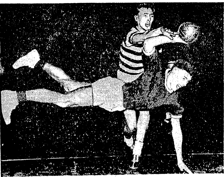
Zawodnik Mucensteru, Marshall oddaje strzał na bramkę w meczu z FC Erishauf, rozegranym podczas międzynarodowych zawodów w piłce ręcznej w Lipsku

MELBOURNE. Podczas zawodów na stadionie olimpijskim nota bene w zawodach tych miał startować Jungwirth, który jednak nabawił się grypy i miał przelozę; swoje starty wzięła forma. Lysy Australijczyk długodystansowiec Albert Thomas. Przebiegł dystans 3000 m. w 13:25,8, białe rekordy swego kraju. Wynik ten odpowiadał mniej więcej czasowi 13:50,0 na 3000 m. z innych wyścigów na uwagę zasługują: 9,9 Hogana na 100 y, 2:03,7 Lincolna na 1 mil oraz 7:57 de Canna w skoku w dal, z wiatrem.