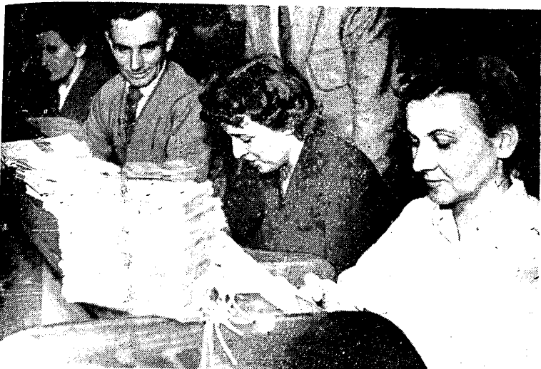
Sprawdzanie kuponów nadesłanych na nasz konkurs „16 zagadek ligowych“

Walny Zjazd Towarzystwa Krzewienia Kultury Fizycznej, który miał się odbyć w dniach 7-8 bm., został przełożony i ostatecznie odbędzie się 14-15 bm. w sali ZNP w Warszawie.