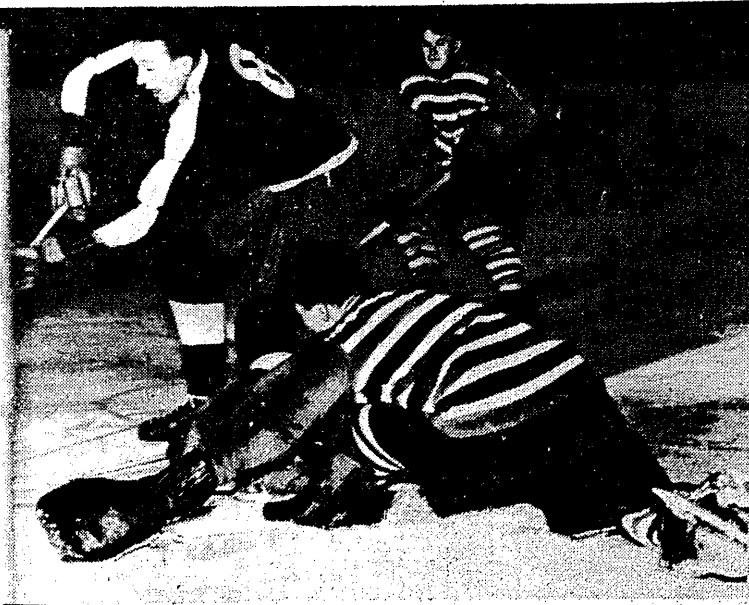
Legia — Podhale 7:2. Tu już Fryzlewicz nie ma nic do powiedzenia. Kurek „zalał“ drugi w tym meczu bramkę.

Celem tej wizyty jest spotkanie szermierczy CSR z mistrzami świata oraz pokazowe walki i pokazowe treningi w wykonaniu naszego mistrza o cz trenera KEVEA. JUREK, przyjeżdżając, wie o sobie nową specjalność — w PRADZE wystąpił bowiem w roli nauczyciela... (jm)