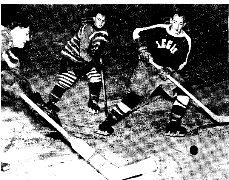
Jeden z przebojów Skotnickiego (Legia) likwiduje bramkarza Podhala Fryzlewicz, ubezpieczony przez Chmurne.

Listę zwycięzców naszego konkursu ogłosimy w naszym poniedziałkowym numerze.