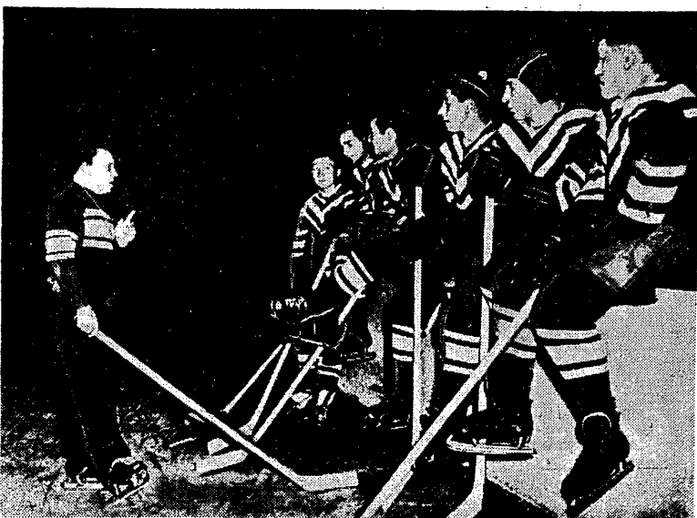
Trener Jegorow w czasie przerwy udziela wskazówek zawodnikom drugiej drużyny Moskwy, bawiącej na tournée w Anglii.

OTTAWA. Hokejowa reprezentacja Moskwy rozegrała siódme spotkanie w Kanadzie, odnosząc czwarte z kolei zwycięstwo. Drużyna radziecka pokonała w meście Kingston reprezentację miejscowego klubu hokejowego 4:2, 1:0, 1:1, 2:1, 2 poprzednio rozegranych spotkań trzy zwycięstwa i jedno zwycięstwo zSSR, dwa — porażki i jedno remisem. Radziecka ekipa zakończyła swoje tournée w czwartek 5 bramkami z młodzieżową reprezentacją Kanady w Ottawie.