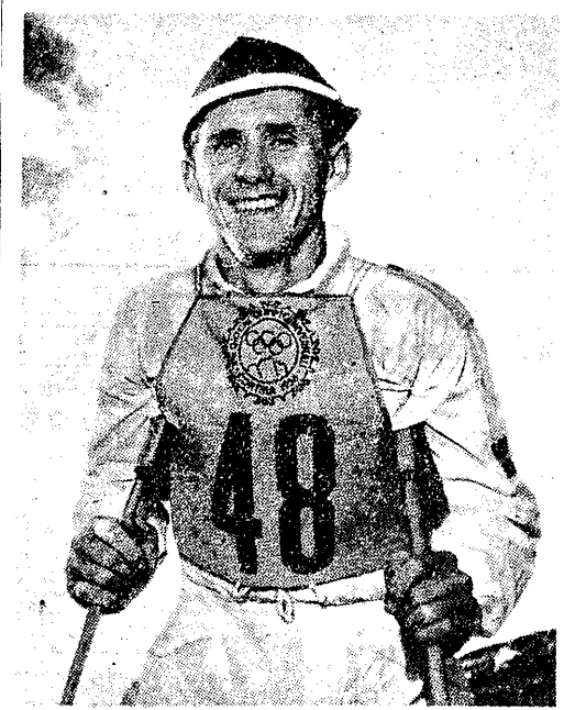
Sixten Jernberg

zajął dopiero szóste miejsce, ulegając czterech radzieckim i fińskim. Obecnie jest już w dobrej formie. Sonja mieszka na północy Szwecji w Lulea, gdzie pracuje w szpitalu.