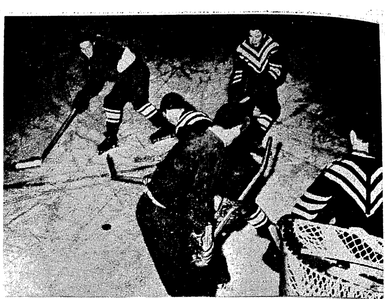
Fragment spotkania Whitby Dunlops — Moskwa 7:2, rozegranego w Toronto