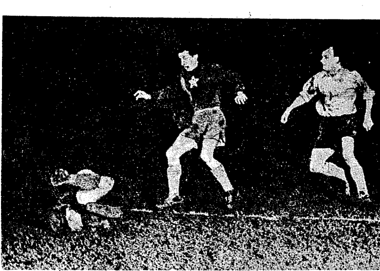
W meczu o Puchar Europy Borussia (NRF) pokonała CCA (Rumunia) 4:2. Było to pierwsze spotkanie tych zespołów. O wejściu do ćwierćfinału Pucharu Europy zdecydowały mecz rewanżowy, który zostanie rozegrany 8 lub 11 grudnia. Oczywiście większe szanse ma zespół Borussii. Na zdjęciu: fragment meczu — pod bramką rumuńską.