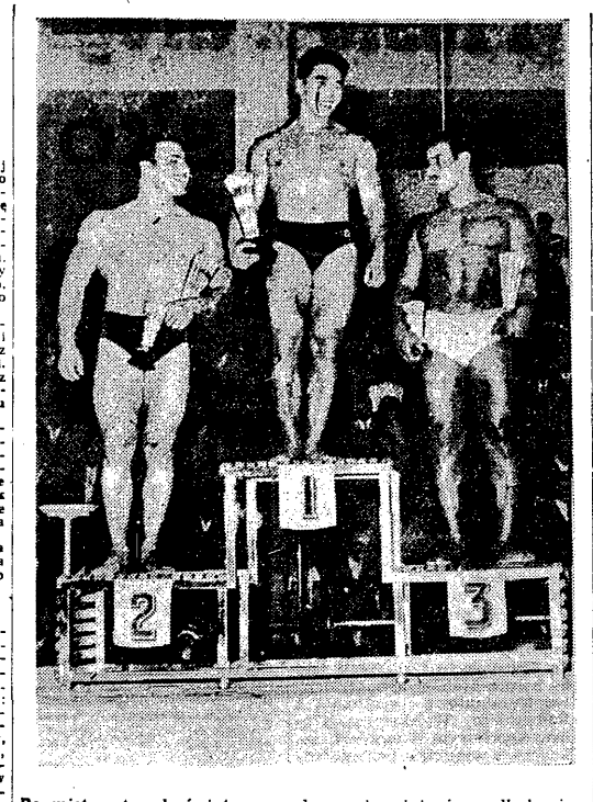
Po mistrzostwach świata w podnoszeniu ciężarów odbył się w Teheranie konkurs na najpiękniejszą sylwetkę atlety. Zwyciężył mistrz świata w w. średniej Kono (USA), 2. Soeren (Iran), 3. Bakun (Burma)

Legia przegrała z Spartakiem Moskwa 3:8. W tym meczu Legia przegrała z Spartakiem Moskwa 3:8. W tym meczu Legia przegrała z Spartakiem Moskwa 3:8. W tym meczu Legia przegrała z Spartakiem Moskwa 3:8.