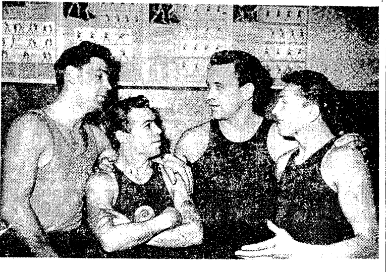
Oto czwórka najlepszych pięciurów...