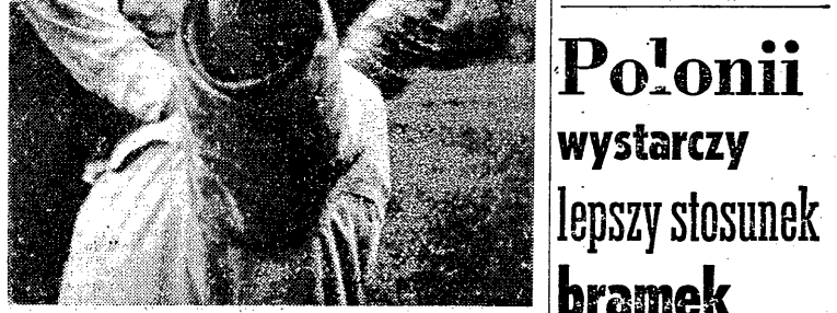
Na ramionach rozentuzjowanego kibiców powędrował Brichczewo do szatni