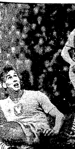
Strach obelżyć obrońców młodzieżowej reprezentacji Polski po jednym z ataków gości...