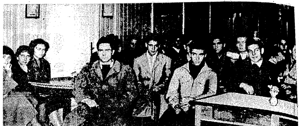
I znów po raz drugi już w tym roku zapamięta się przystać KW Wisła nowymi adeptami sztuki wiosłowania, którzy zgłosili się do zaciągu wiosłarskiego Wisły i Przeglądu Sportowego...