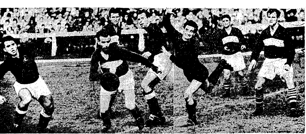
Bramkarz Piasta Nowej Rudy — Gabryel był podczas meczu z warszawską Polonią... Obok Gabryela najgroźniejszy strzelec polonistów — Zelenny, a w rągu z lewej łącznik — Olszewski.