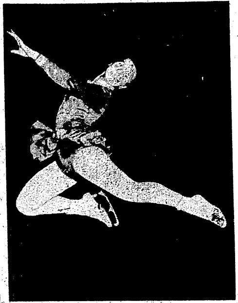
Basia Jankowska podczas treningu na nowoutwartym sztucznym łożysku w Łodzi