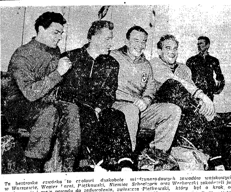
Ta bestronka czwórka to czolowi dyskolabi mi-zymnadowych zawodow wojskowych w Warszawie