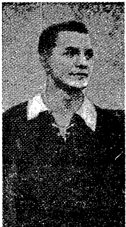
Pracujący łącznik Rapidu i reprezentacji Austrii Diest — niesłuszny bohater spotkania Austrii — Holandii (3:2)