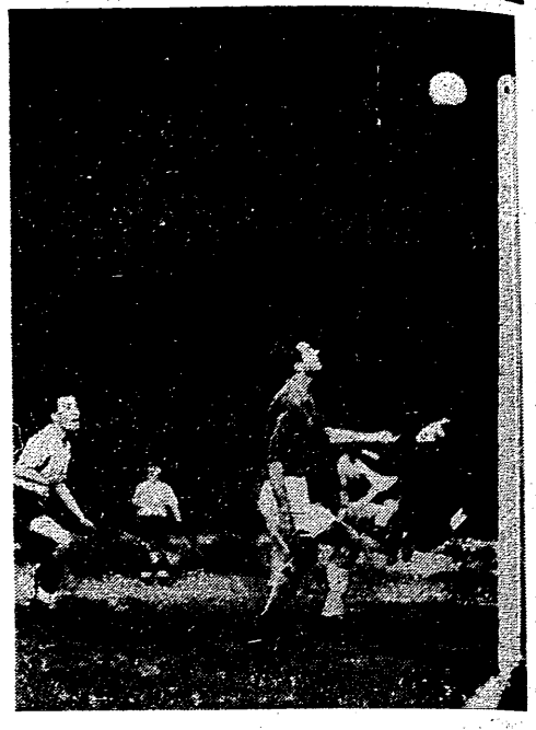
Fragment spotkania w piłce nożnej między Anglią B i Bułgarią B (6:2). Srodkowy napastnik Anglii — Keen (z lewej) zdobywa głową trzecią bramkę dla swojej barwy...