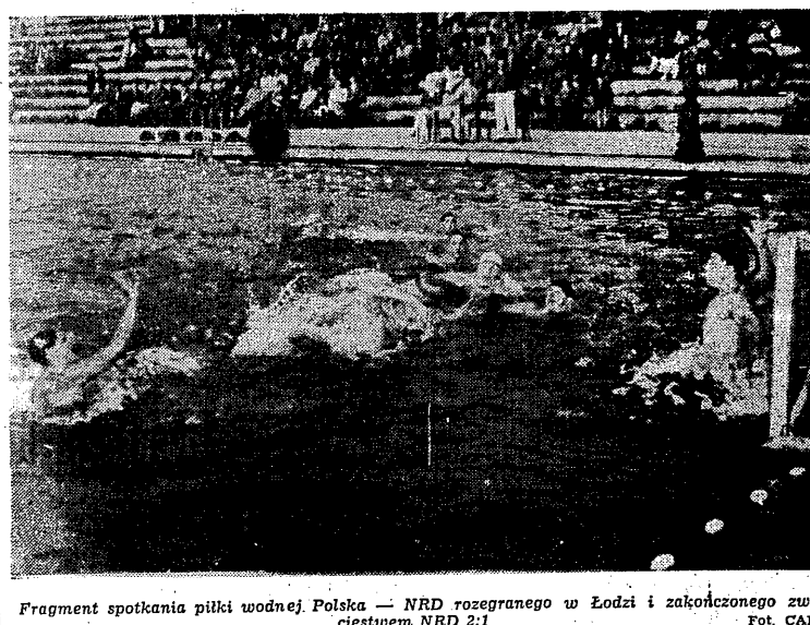
Fragment spotkania piłki wodnej. Polska — NRD rozegrane w Łodzi i zakończonego zwycięstwem NRD 2:1.