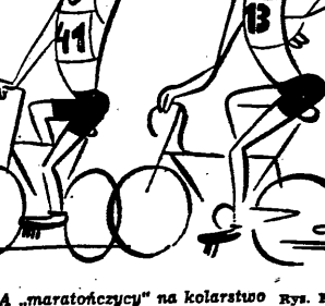
Rys. E. Alaszewski

„maratończy” na kolarstwie Rys. E. Alaszewski