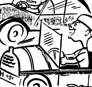
Kolarze na automobilizmie