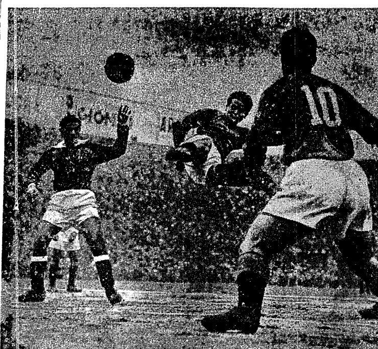
Acrobacyjny skok włoskiego reprezentanta — Boniperti. Takich zagrań mogą mu pozazdrościć nasi zawodnicy