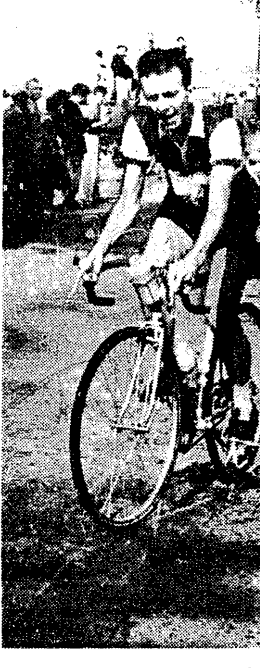
Kowalski zaopatrzył się w produkty żywnościowe na trasie do Opola