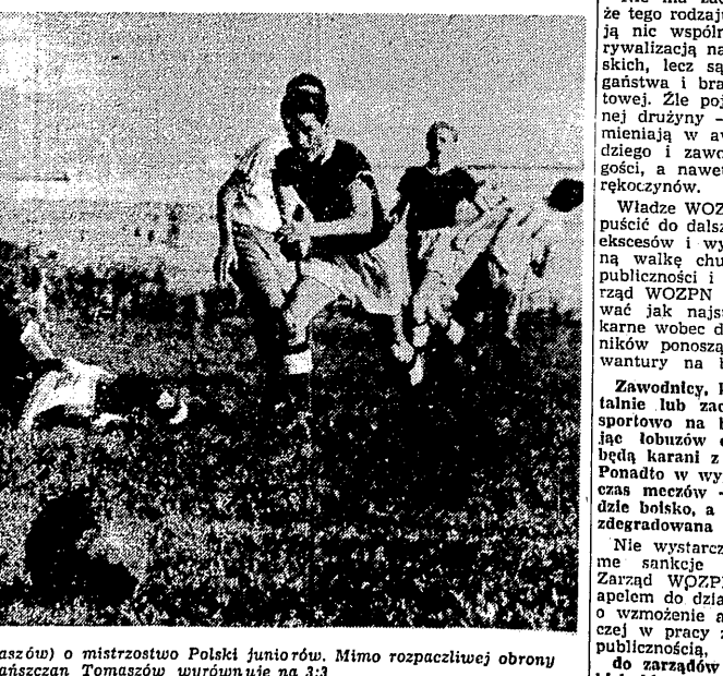
Lechia (Gd.) — Lechia (Tomaszów) o mistrzostwo Polski juniorów. Mimo rozpaczy obrony gdańszczan Tomaszów wyrownuje na 3:3.