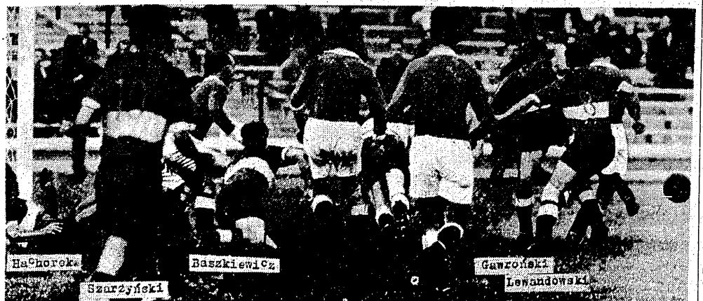
Taki tłok panował niemal przez cały mecz warszawskiej Gwardii z RSC Vervietois 2:0, pod bramką drużyny belgijskiej