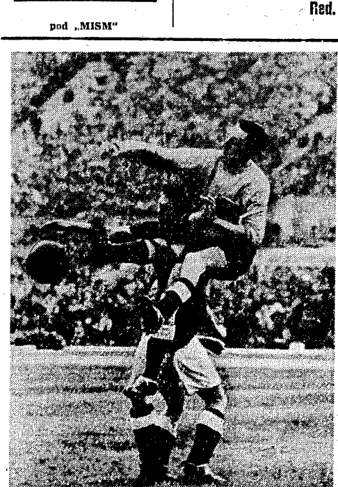
Bramkarz belgijski wyjaśnia sytuację

MOSKWA 28.7. (tel. wł.) Jolice narazie nie udało się do młodzieży, zebranej w Moskwie na VI Festiwalu i III Igrzyskach Sportowych. Po podaniu w niedzielę pokazano się błękitne niebo i na wypełnionym po brzegi stadionie na Łużnikach w czasie uroczystości otwarcia Festiwalu było wręcz gorąco. W loży honorowej obecni byli m. in. członkowie przywódcy ZSRR Chruszczow i Bulganin. Tysiące ludzi, którzy nie dostali się na stadion, obiegło Leninowskie Wzgórze po drugiej stronie Moskwy.