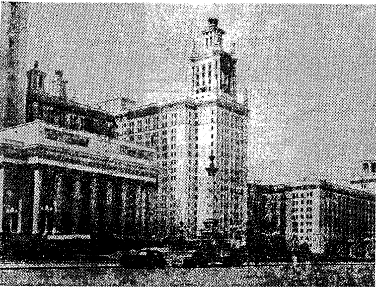
Ogólny widok Uniwersytetu im. Lomonosowa, gdzie mieszka polska delegacja na III MISM