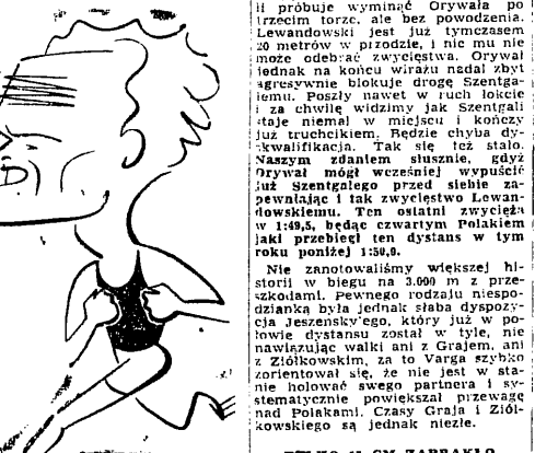
W biegu na 10.000 m pewnie zwyciężył Węgier Kovacs