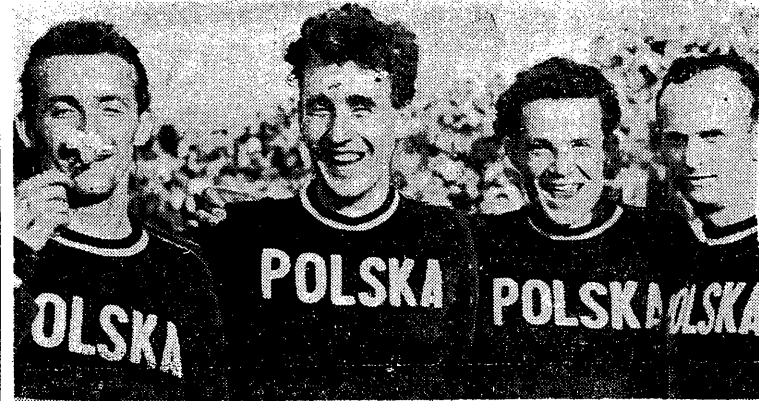
przeprowadzić i u nas podobny proces. W chwili potem głos zabrał wiceprzewodniczący PZLA