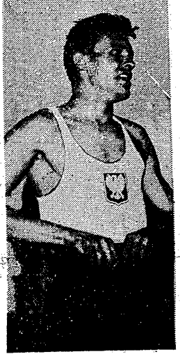
Szczęśliwy i zadowolony Folk uśmiecha się. Nie dziwnie, wymazane starego, od 7 lat niepublika rekordu Kizki, sprawiła chyba wielką przyjemność

PARYZ. Na zawodach lekkoatletycznych w Bordeaux, gdzie stawali również zawodnicy amerykańscy Francuz Macquet przetrząsł 80 m w oszczepie. Ustanowił on nowy rekord Francji wynikiem 80,60 zwyciężając Amerykanina Froma (75,58). Mistrz olimpijski Deter (USA) wygrał dysk dosko- nalszym wynikiem 57,07. W młocie zwyciężył Amerykanin Hall, wynikiem 60,37 przed Francuzem Hussonem 58,26. Sowell (USA) wygrał 400 m w 47,1, a Sime (USA) 100 m w 10,5.