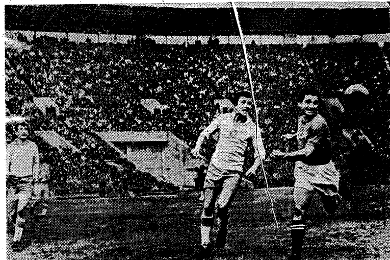
Na boisku moeklewskim gra nastych reprezentantów wybitnie „nie kleła się” i dlatego musieli oni opuścić boisko jako pokonani.