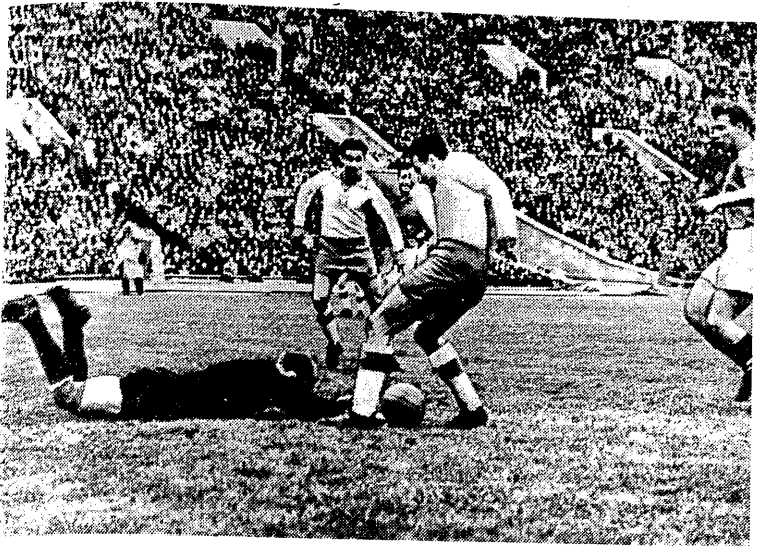
Jeden z momentów podbramkowych na meczu między Polską i ZSRR rozegranym w ub. niedzielę w Moskwie. Jak widać w spotkaniu tym zwyciężyli zawodnicy radziecy 3:0