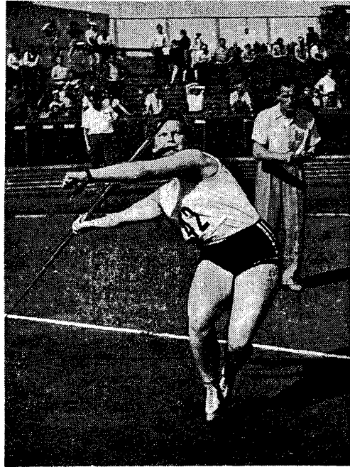
Czy pojedynek Figwerówny z Zatópkową przyniesie nam nowy rekord w oszczepie?