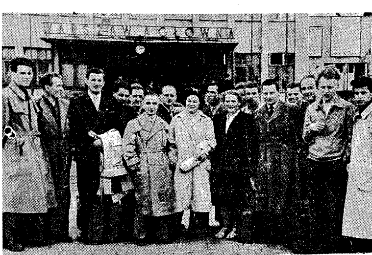
Zwycięzcy konkursu za 5 zł do Pragi na Mistrzostwa Europy w Boksie dla amatorów zawodowców na dworcu w Warszawie.

B EDAC w Pradze na Bokserskich mistrzostwach Europy, czwarty przykrocie triumfując zwyciężczy. Konkursu - Loterii PKO, oraz - Przegiędy Sportowców. Zorganizował Międzynarodowy Związek Bokserski, szczególnie w hali Zimowego Stadionu, sławny był nie tylko trybuną, ale i korytarzami, gdzie w przerwach między walkami, widać było wesołą i pogodną atmosferę. W hali, w której odbywały się walki, widać było wesołą i pogodną atmosferę. W hali, w której odbywały się walki, widać było wesołą i pogodną atmosferę.