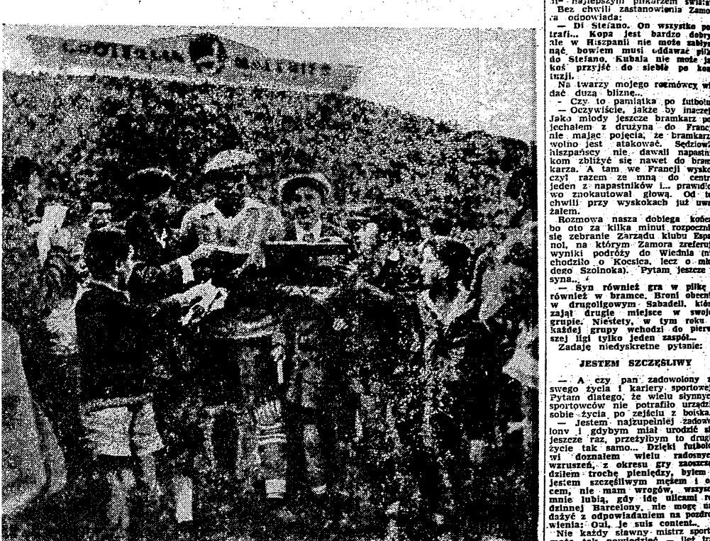
Najlepszy bramkarz świata Hiszpan Zamora odprowadzany po meczu Madryt - Tenis Borussia w Berlinie przez młodych entuzjastów piłkarstwa...